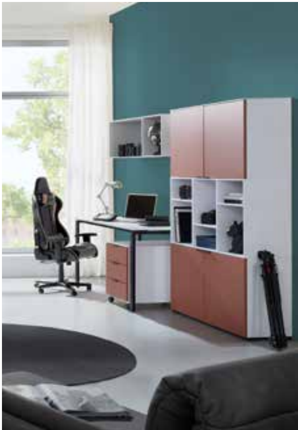
SET-UP Jugendzimmer in Dekor, mit Stapelbett