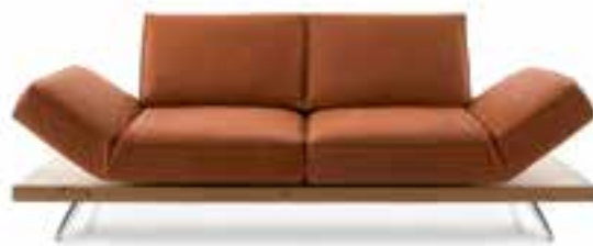
PHEONIX Einzelsofa in Echtleder oder Stoff, auf Plateau Wildeiche furniert, mit Metallkufen