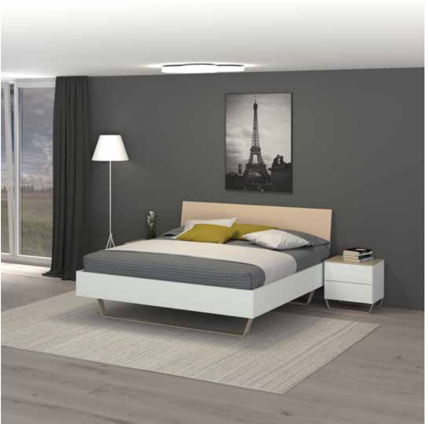
MOANA Bett in Lack, dazu passende Nachttische