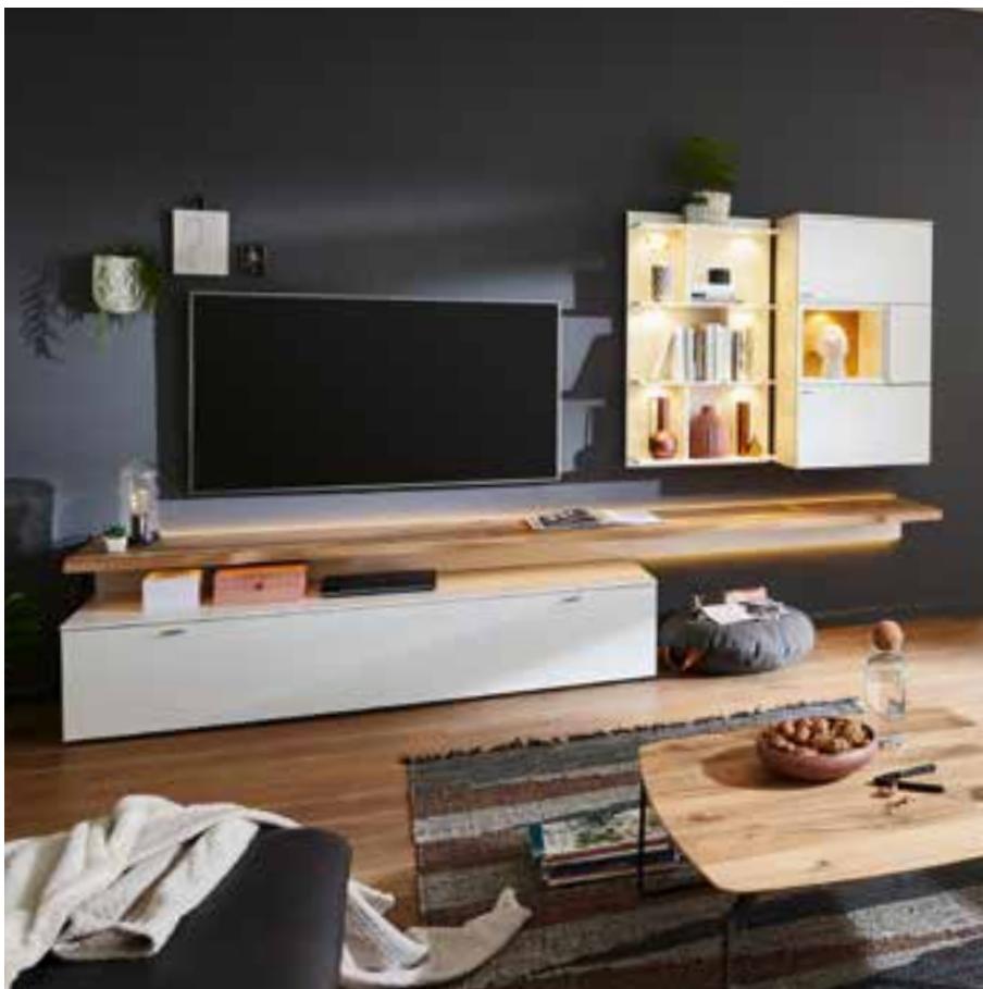
XENIA Wohnprogramm ← in Lack, Panel in Wildeiche furniert gebürstet, optional mit Beleuchtung