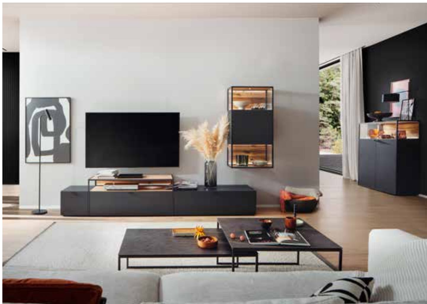
XAVIO Wohnprogramm in Lack, Akzente in Eiche rustico furniert, optional mit Beleuchtung