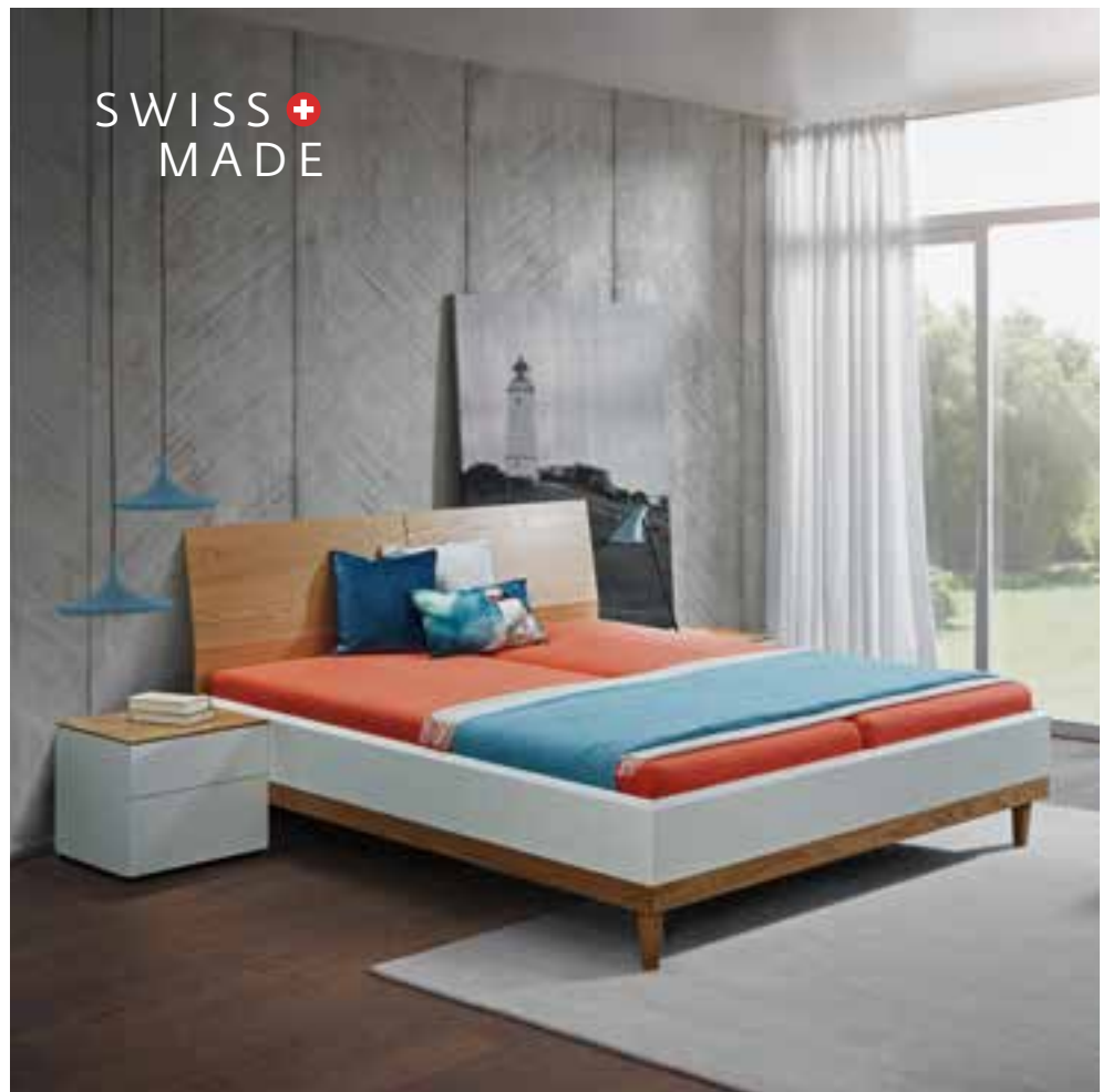
MARA Bett → in Lack und Eiche furniert, Doppelbett kann in zwei Einzelbetten umgestellt werden