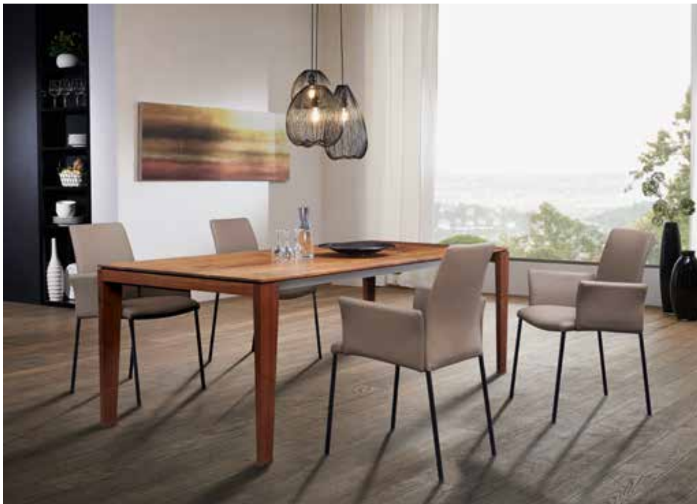
PARIS Esstisch in Nussbaum massiv natur geölt, Tischbeine konisch, optional mit Auszug