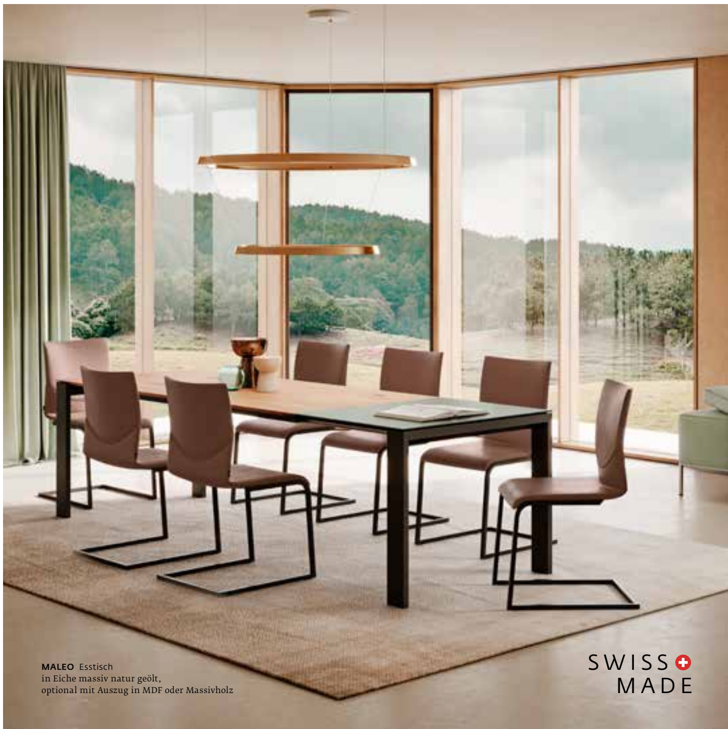
MALEO Esstisch in Eiche massiv natur geölt, optional mit Auszug in MDF oder Massivholz