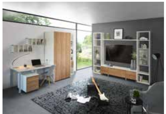
WINDOW Studio in Dekor weiss und Eiche, Kombination mit Schrankklappbett