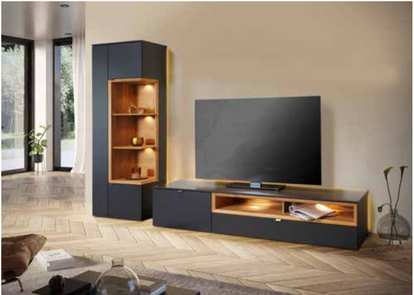
ADRIA Wohnprogramm ↑ in Lack, Akzente in Wildeiche furniert gebürstet, optional mit Beleuchtung