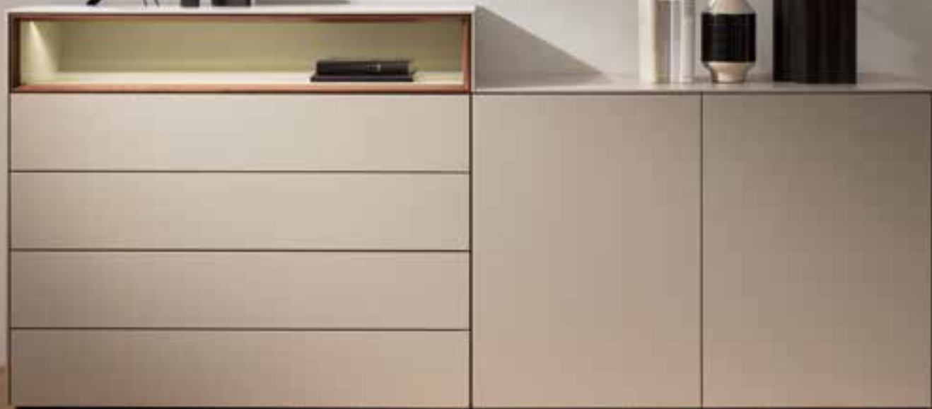
NUBIA Sideboard in Lack, mit Akzenten in Nussbaum furniert