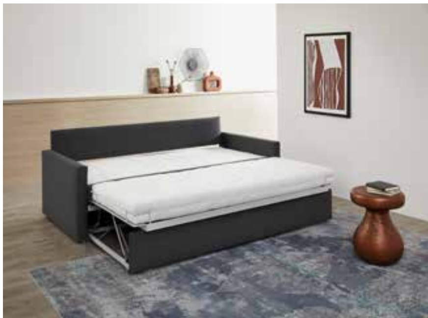
NALU Bettsofa in Stoff, Funktion Querschläfer