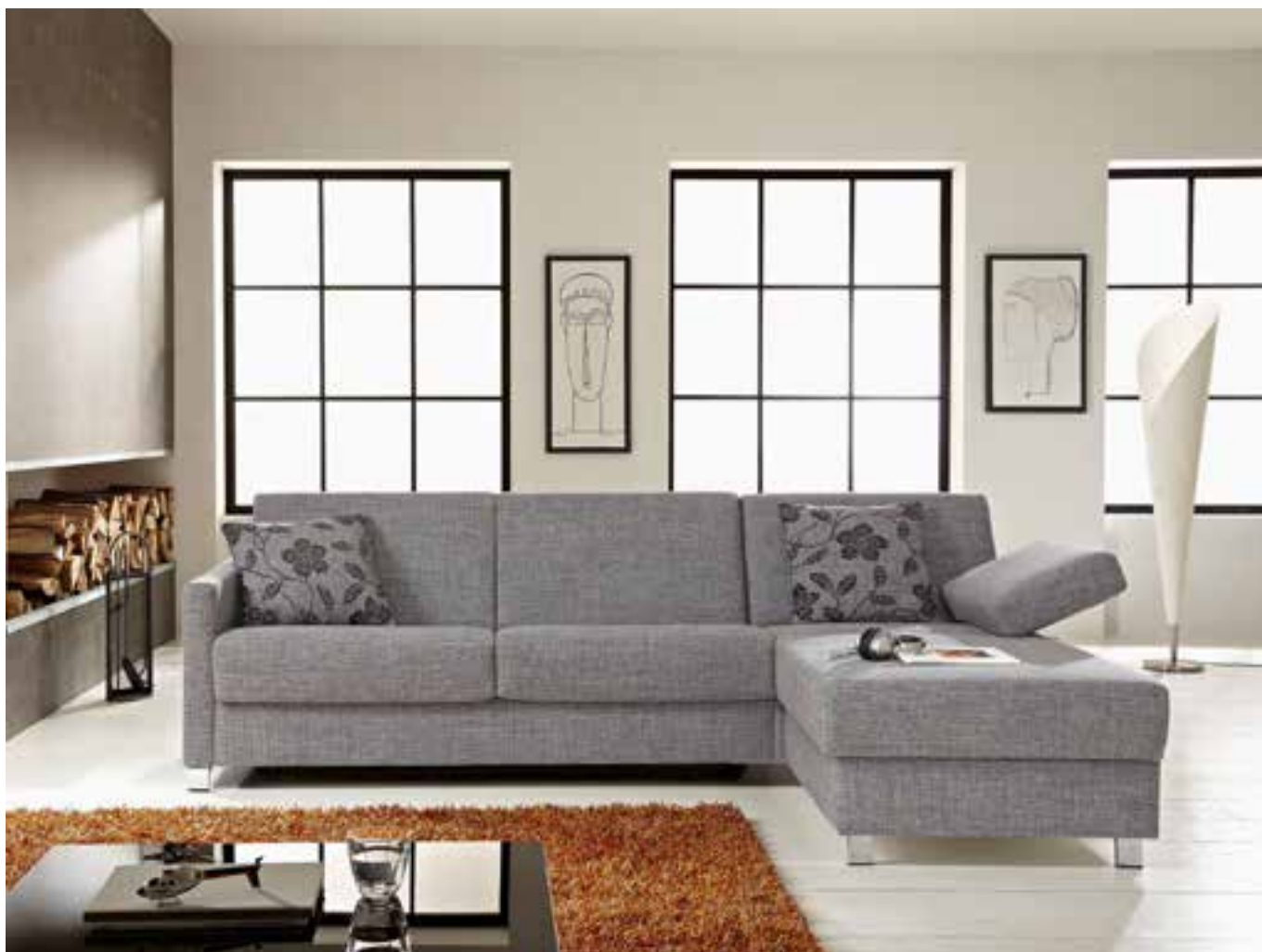
BRETAGNE Bettsofa in Stoff, Funktion Längsschläfer