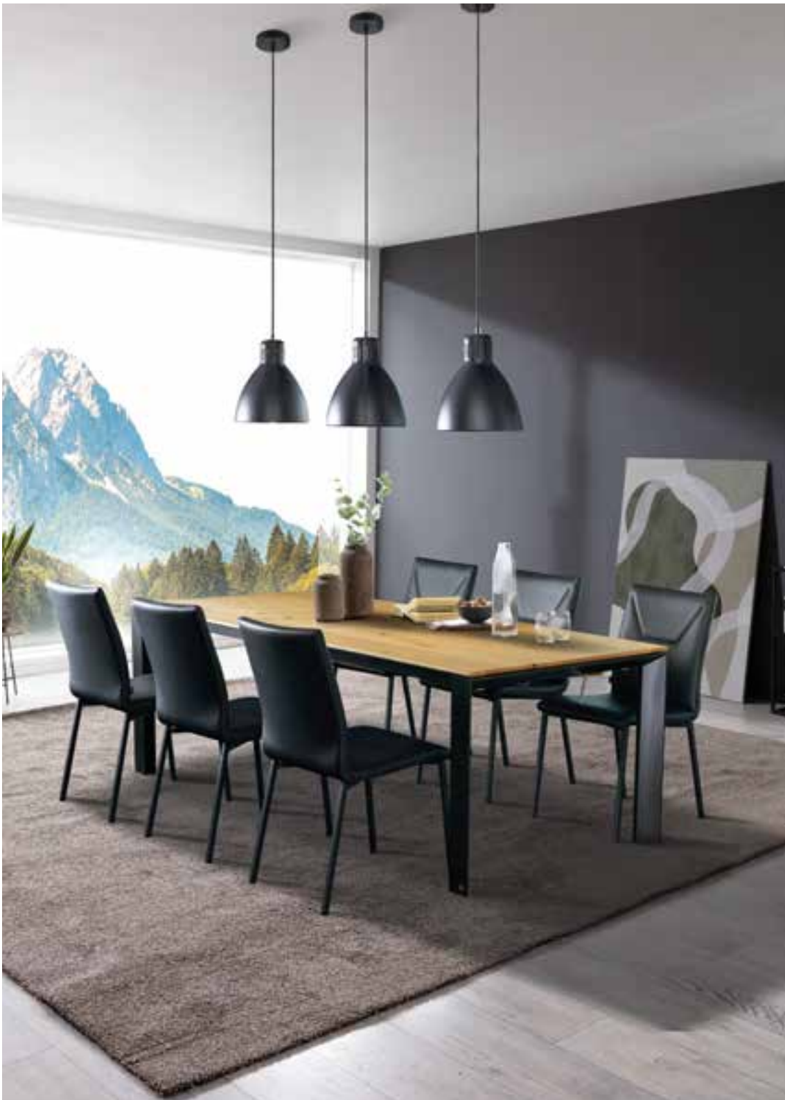
DANA Esstisch in Asteiche massiv natur geölt, optional mit Auszug