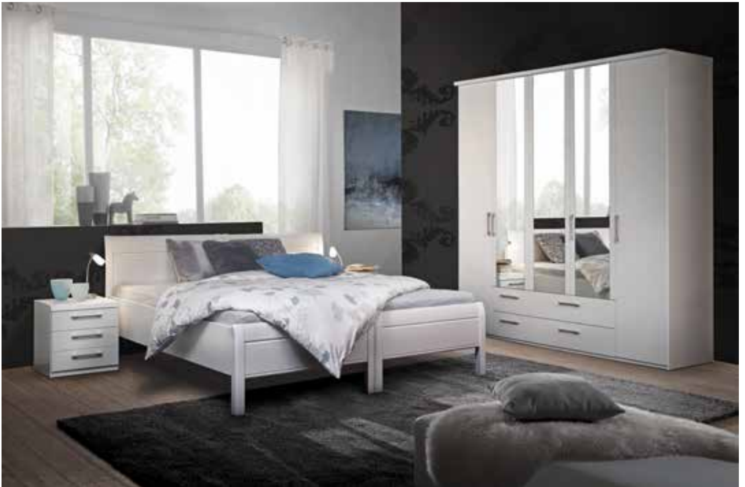
CHELLES Schlafzimmer ↑ in Lack, Bettgruppe kann auch getrennt gestellt werden