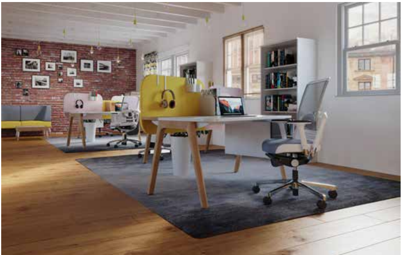
ERCOLANO Büroprogramm ← Regal mit eingeschobener Schreibplatte

Mit einem durchdachten Stauraum gewinnen Businessutensilien Platz – und Ihr Zuhause Ordnung. Für effizientes Arbeiten sollten die Arbeitsmittel übersichtlich und funktionell untergebracht werden. Das schafft nicht nur Struktur, sondern sorgt auch für ungeminderte Wohnlichkeit.