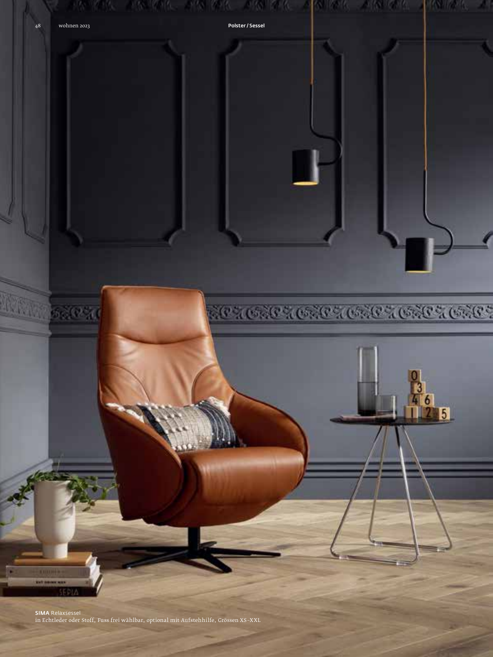
SIMA Relaxesessel in Echtleder oder Stoff, Fuss frei wählbar, optional mit Aufstehhilfe, Größen XS-XXL